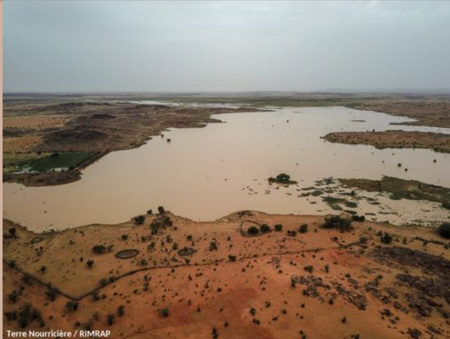
Terre Nourricière / RIMRAP