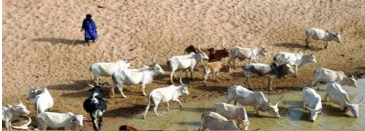
Plate-Forme de Dialogue Sectoriel